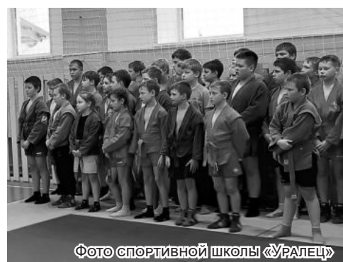
Фото спортивной школы «УРАЛЕЦ»

В МИНУВШУЮ СУББОТУ в отремонтированном спортивном зале Рудновской школы состоялось первенство по борьбе самбо среди мальчишек и девчонок. Организатор соревнований – районная спортивная школа «Уралец».